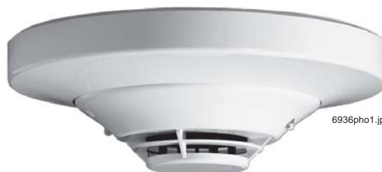
FST-851 em base B701LP